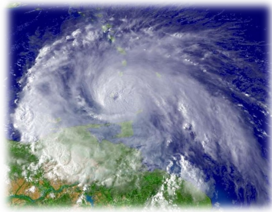
Image d'un cyclone

Il peut y avoir des cyclones tropicaux. Un cyclone tropical est une zone de nuages orageux accompagnée de vents très forts.