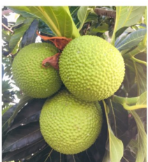
Fruit de l'arbre à pain « uru »