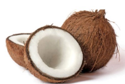
Une noix de coco