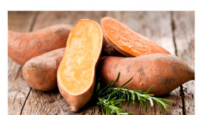
Une patate douce