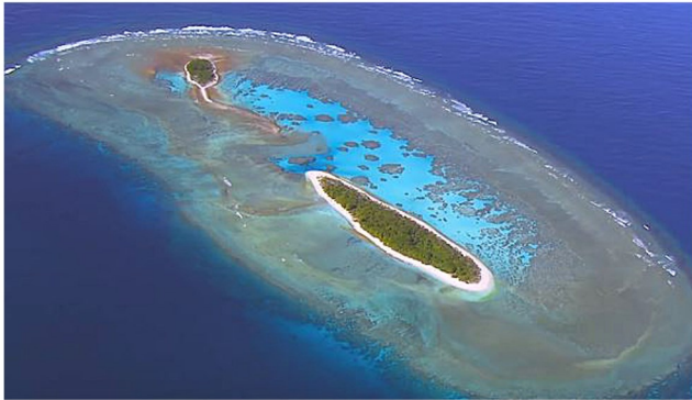
Barrière de corail vue du ciel

Tahiti possède aussi un lagon, c'est-à-dire un petit lac d'eau salée entre la terre et un récif corallien.