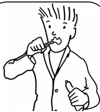
Se brosser les dents