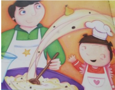
PAPA GÂTEAU Papa gâteau