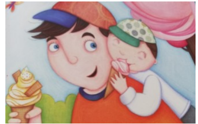
PAPA COPAIN Papa copain