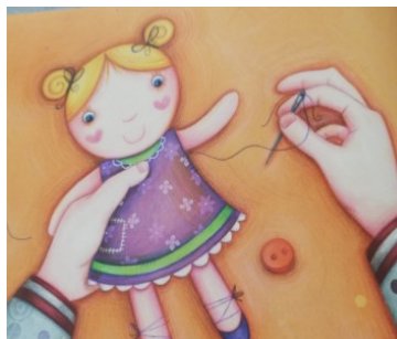
PAPA BRICOLE Papa bricole