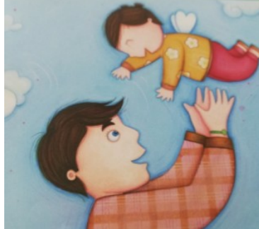
PAPA COSTAUD Papa costaud