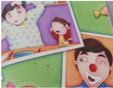
PAPA CLOWN Papa clown