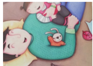
PAPA CHATOUILLE Papa chatouille