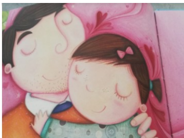
PAPA CALIN Papa calin