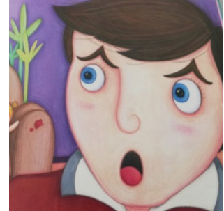
PAPA GROS YEUX Papa gros yeux