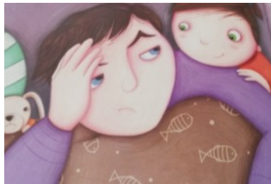
PAPA OURS Papa ours